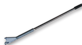
222219.900 Universal dækselnøgle